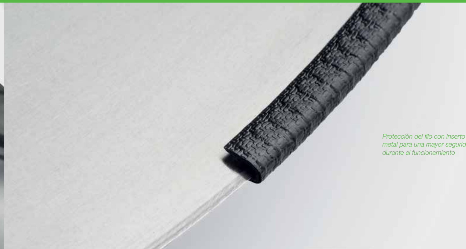
Protección del filo con inserto de metal para una mayor seguridad durante el funcionamiento