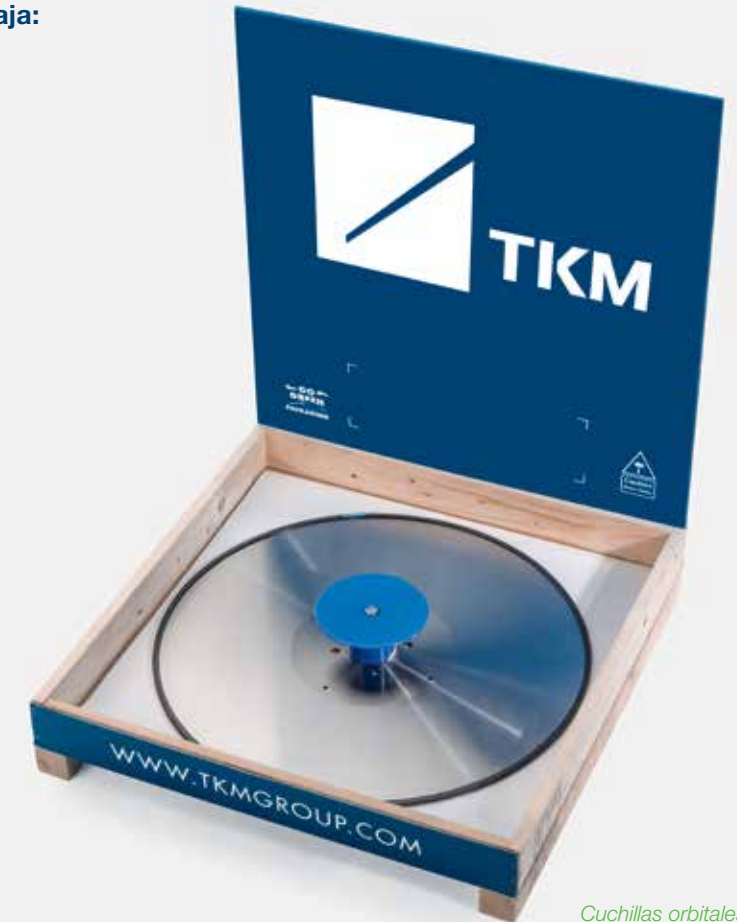
Cuchillas orbitales en caja