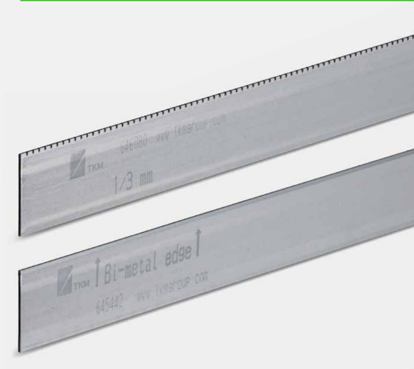
Cuchillas perforadoras y cuchillas lisas para todas las máquinas actuales